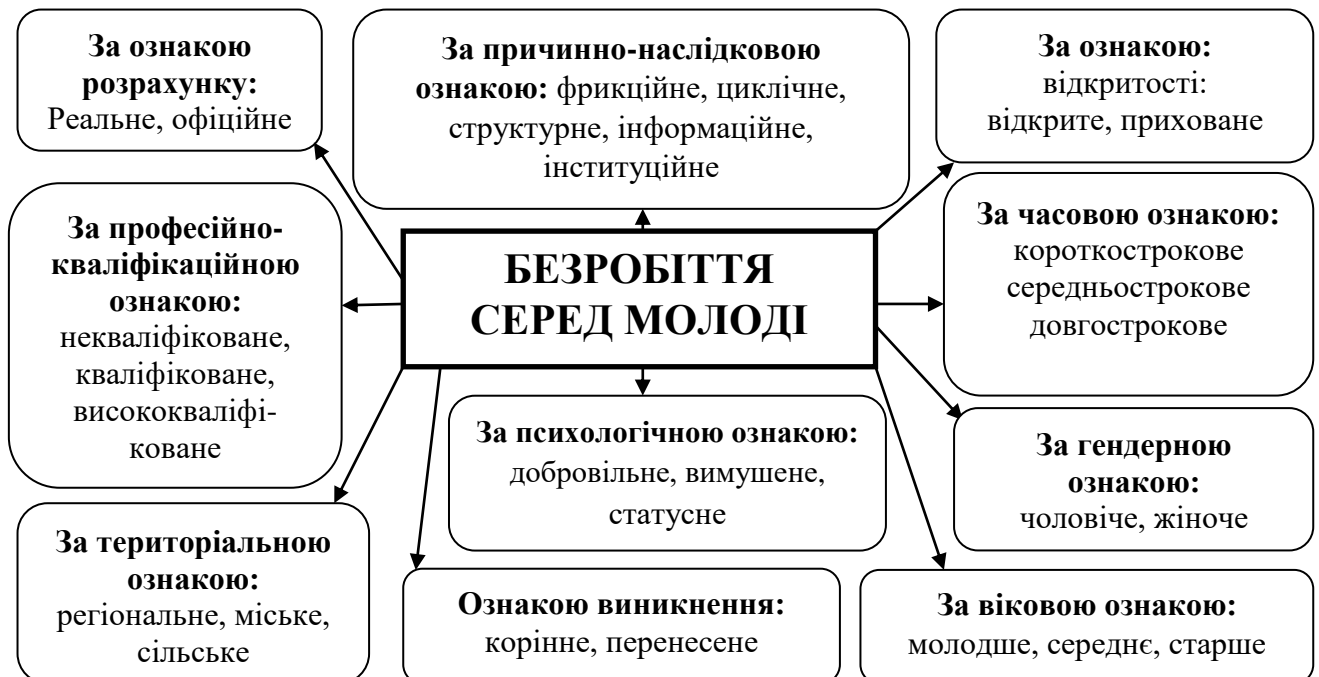
Рис.1. Класифікація основних видів молодіжного безробіття в сучасних умовах (складено автором).

На рис.1 представлено класифікацію основних видів молодіжного безробіття у теперішній час. Різноманіття видів безробіття відображає складні процеси впливу різних тенденцій розвитку ринку праці та соціально-трудоких відносин.